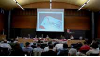
● Organisationskonferenz Seiten 4-5