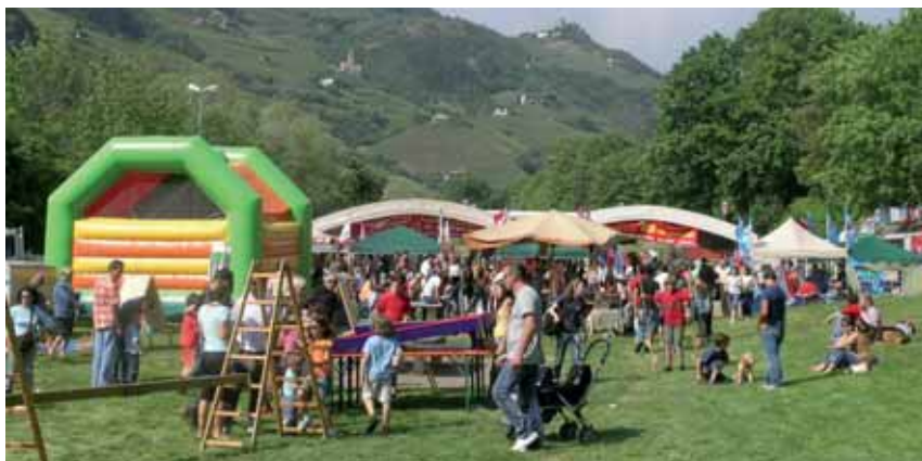
1.-Mai-Fest: Comeback auf den Talferwiesen

Das traditionelle 1.-Mai-Konzert fand wie immer in Rom auf der Piazza San Giovanni statt, Star-gast war heuer US-Legende Chuck Berry.