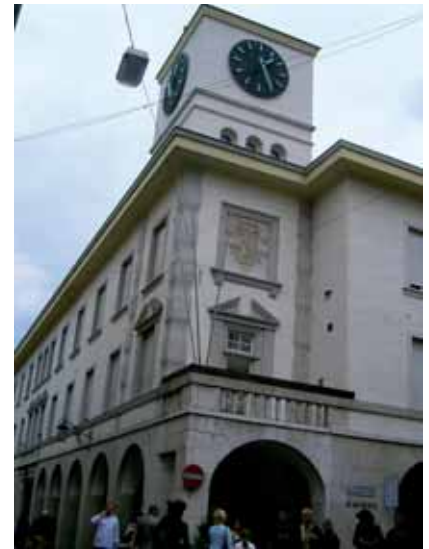
Rathaus Meran: Der Stadtviertelrat wünscht für Sinich mehr Dienste

Sinich hat nicht ganz zu Unrecht das Image einer Trabantenstadt, einer Vorstadt mit wenig eigener Infrastruktur. Vor allem fehlen in Sinich einige notwendigen Dienste. Seit etwa zwei Jahren bemüht sich auch der neu gegründete Stadtviertelrat um die Lösung verschiedener Probleme. Dieser unterbreitete der Gemeinde bereits eine Reihe von Verbesserungsvorschlägen. So wurde zur Verkehrsberuhigung die Reduzierung des Durchfahrtsverkehrs, vor allem des Schwerverkehrs, sowie die Wiedereröffnung des Bahnhofs Sinich vorgeschlagen. Der Stadtviertelrat regte zudem eine dauerhafte Lösung für das provisorische Schulgebäude für die deutschsprachigen Schulkinder an. Weiters werden ein Ambulatorium