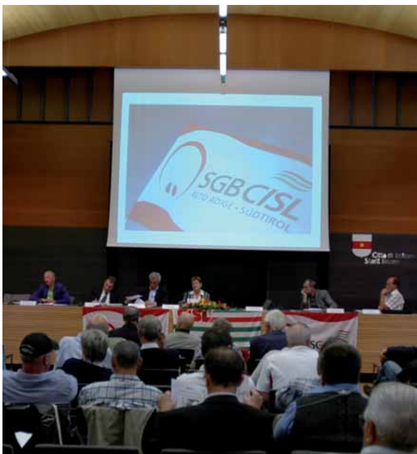
Rund 150 Delegierte aus allen Landesteilen nahmen an der Organisationskonferenz im Festsaal der Gemeinde Bozen teil.

Probleme der Menschen zu lösen. Vorrangig müsse die Erneuerung von Kollektivverträgen sowie die Lösung der Rentenfrage vorangetrieben werden. Die sprunghafte Anhebung des Renteneintrittsalters ab 2008 müsse abgeschwächt werden, so Santini. Die fortschreitende Flexibilisierung in der Arbeitswelt erfordere geeignete soziale Sicherungssysteme, sonst droht das Fortschreiten der Präkarisierung.