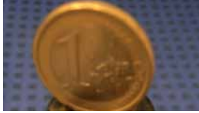
● Abfertigung & Zusatzrente Seite 7