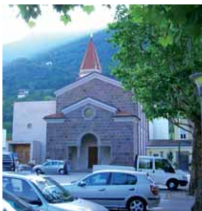
Eine Teilansicht des Sinicher Hauptplatzes

In den 70er Jahren gab Montecatini seinen Standort in Sinich auf. Zahlreiche Arbeiter verloren ihre Arbeit; andere wanderten ab, um in anderen Montecatini-Werken außerhalb