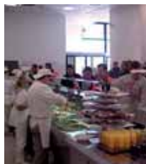
Die Mensa der Industriezone Brixen

Es gelang, mit einigen Betrieben der Industriezone Vereinbarungen zu treffen, wodurch deren Beschäftigte den Mensadienst kostengünstig in Anspruch nehmen können. Die Anzahl der ausgegebenen Mahlzeiten