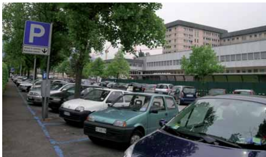
Blaue Parkzone vor dem Bozner Spital: zahlen auch Sonntags

mittel umzusteigen? Umweltschutz ist grundsätzlich zu begrüßen. Wie sollen dann aber die Baukosten finanziert werden? Indem die Parkgebühren im Stadtzentrum erhöht werden? Wohl kaum, das würde einigen Interessensgruppen nicht gefallen. Wer ins Spital fährt, hat ohnehin andere Sorgen.