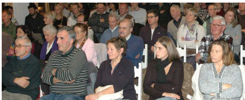
Die alljährliche Veranstaltung fand heuer am 5. Dezember wieder in Reischach statt und lockte zahlreiche Delegierte an.