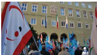
● Kosten der Politik