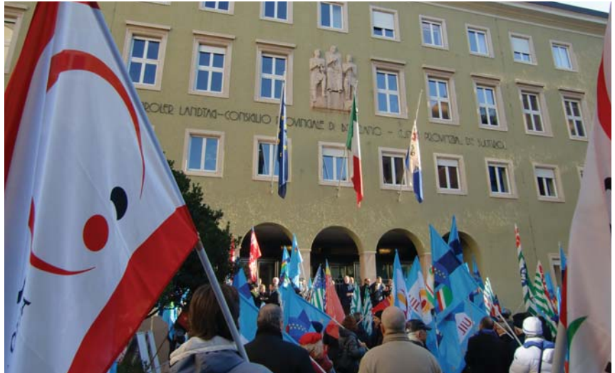
Rund 250 Kundgebungsteilnehmer versammelten sich vor dem Landtag, um die Abgeordneten zur Reduzierung ihrer Bezüge aufzurufen

Die Abgeordneten wurden aufgerufen, bis Ende des Jahres einen konkreten Schritt in Richtung Re-