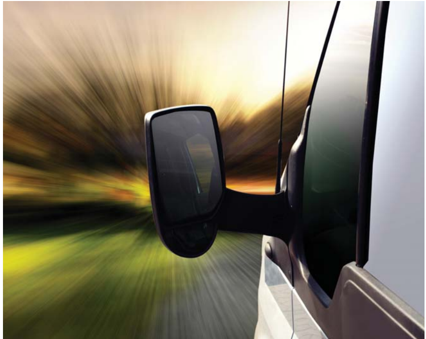
Bei den Paketzustelldiensten sind der Kosten- und Zeitdruck groß. Die Gewerkschaft schreit ein, wenn Arbeitnehmerrechte auf der Strecke bleiben.

Wir hatten Fälle von Ausfahrern, die mit Teilzeitverträgen bzw. mit Arbeit auf Abruf beschäftigt waren, obwohl sie Vollzeit arbeiteten, oder solche, die immer wieder vorübergehend abgemeldet wurden, obwohl sie durchgearbeitet haben.