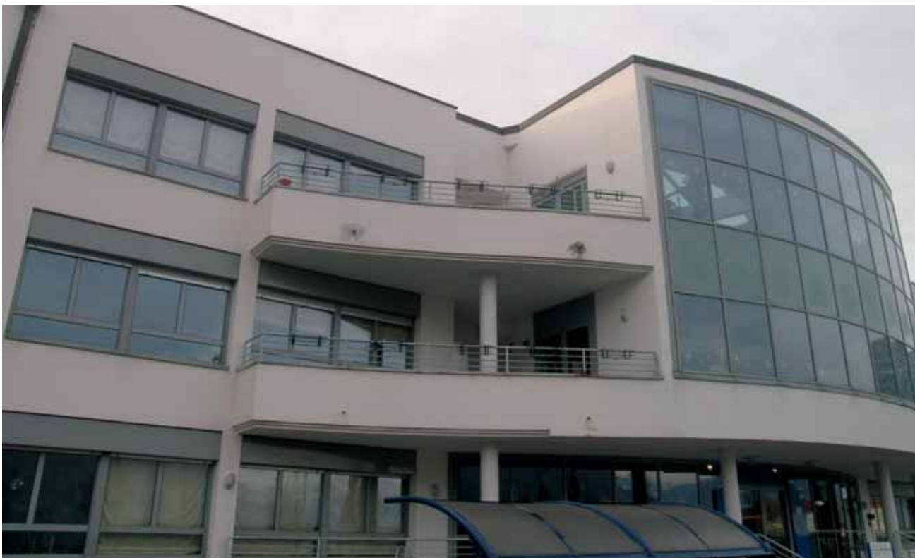
Im Bild die Einrichtung für Langzeitkranke „Firmian“ in Bozen.

Mauro Todesco Landessekretär der Fachgewerkschaft Öffentliche Dienste