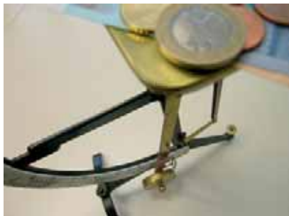
Einkommen und Vermögen sollen einfacher, unbürokratischer und gerechter bemessen werden, wenn es um die Ansuchen auf soziale Leistungen geht.

Hinzu kommt, dass das Vermögen bei der Bewertung der wirtschaftlichen Lage derzeit kaum berücksichtigt wird. Bisher zählt hauptsächlich das erklärte Einkommen laut Steuererklärung, während andere Einkommenswerte – z. B. Liegenschaften, die gewerblich genutzt werden – kaum oder gar nicht zählen. Vermögen, sprich Immobilien oder Finanzvermögen, schlagen sich wegen hoher Freibeträge weniger auf die Bemessung der wirtschaftlichen Lage nieder als erklärtes Einkommen. Dies führt unter Umständen dazu, dass Personen mit gleichem Einkommen, aber mit unterschiedlichen Vermögenswerten, als gleich bedürftig gelten.