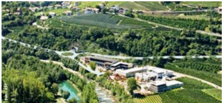
La galleria della nuova circonvallazione sotto Monte Benedetto porterà dalla Stazione e dalla MeBo fino alla zona artigianale di Tirolo, dove è prevista una rotatoria con strade di collegamento in direzione Maia Alta e Val Passiria (nell'immagine il rendering dell'uscita della galleria e la rotatoria. Foto: ASP)

cambiamenti necessari. Mentre si può desumere un forte miglioramento della situazione per quanto riguarda il traffico individuale, resta quale punto di domanda su quale sarà l'effetto che la circonvallazione produrrà sulla mobilità e il traffico in generale.