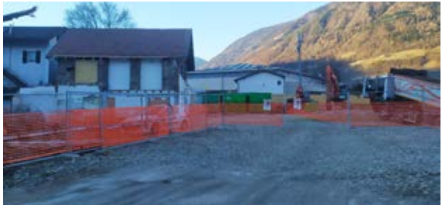
Iniziati i lavori presso il Cantiere comunale vicino alla Stazione ferroviaria

Tuttavia, sarà poi necessario monitorare attentamente il traffico per poter intervenire in modo mirato e apportare i