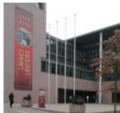
Il Comune di Laives in via Pietralba, dove si trova anche la nostra sede

Si propone di ampliarlo e renderlo di facile accesso a tutti i cittadini di Laives.